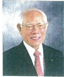
講師 2012-13年度 国際ロータリー会長 田中 作次 氏