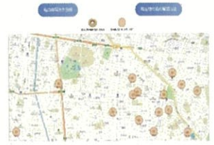
実績マップを掲載予定