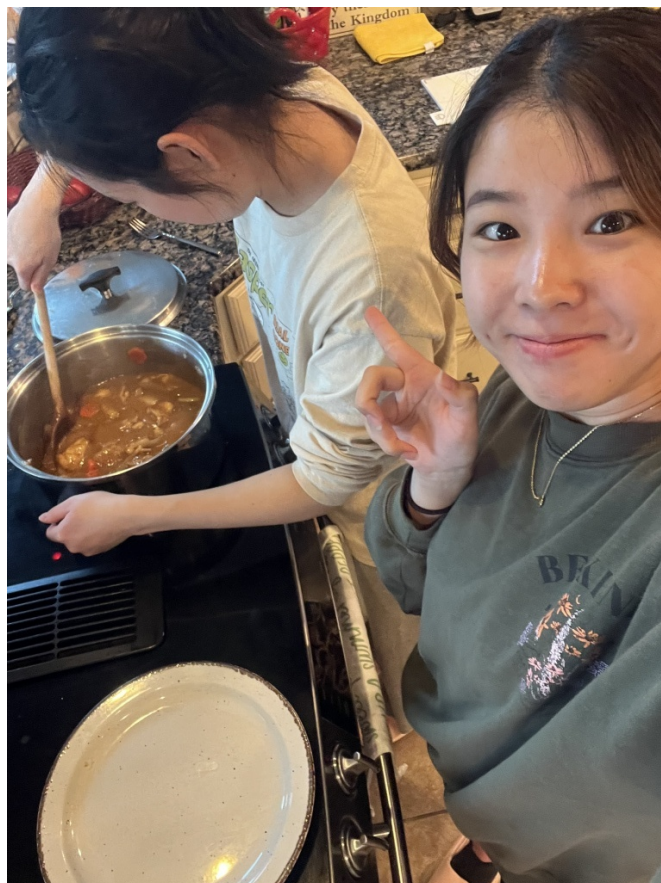
カレーライス作り